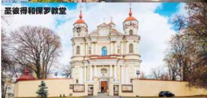
圣彼得和保罗教堂